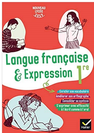
Langue française et expression 1ère, HATIER (2019)